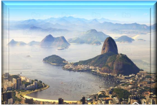
Rio de Janeiro